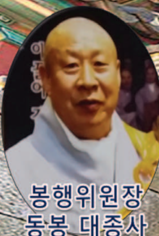
봉행위원장 동봉 대종사

오늘날 대한민국이 있기 까지에는 수없이 많은 외세의 침략으로 나라가 위태로울 때마다 우리 민족의 불굴의 정신과 생명을 아끼지 않는 선열들의 값진 희생이 있었습니다. 우리는 그들을 위해서 봉행합니다.