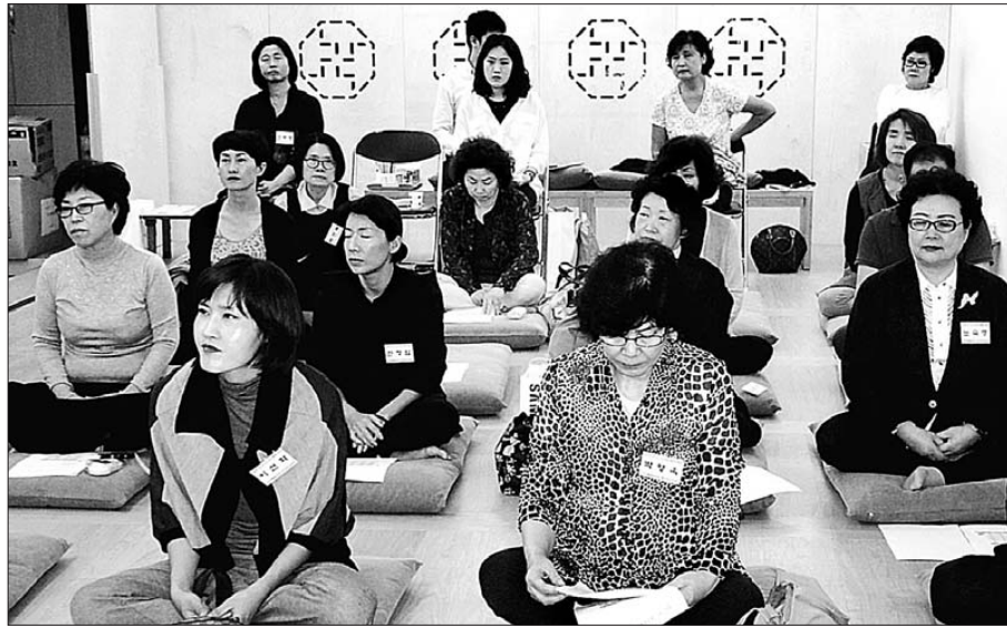
지혜로운여성 명상리더십센터에서 개최한 ‘일상의 심, 몸 마음 통합 힐링 명상’ 강연에 참석한 불자들

키우려면 명상을 해야 한다고 강조했다. 그는 “서구의 세계적인 기업들은 명상교육을 실시하고 있다. 명상경영지도자로 활동하는 뉴욕의 유명 CEO인 마이클 케럴은 <Awake at work>라는 책을 통해 마음수행 때 모든 존재는 서로 연결되고 서로를 위하고 살리는 둘 아닌 존재들이다. 이는 대승보살에 잘 드러나며 대승보살은 바로 21세기 인류가 지향하는 최첨단의 인간상”이라고 설명했다.