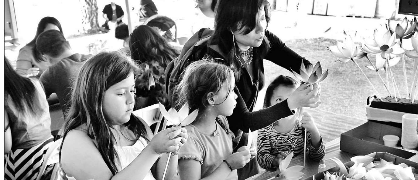
한국불교종단협의회와 남가주사원연합회 등은 9월 25일부터 29일까지 LA 한인타운에 열린 한인 축제에서 한국불교 문화를 알리는 행사를 가졌다.