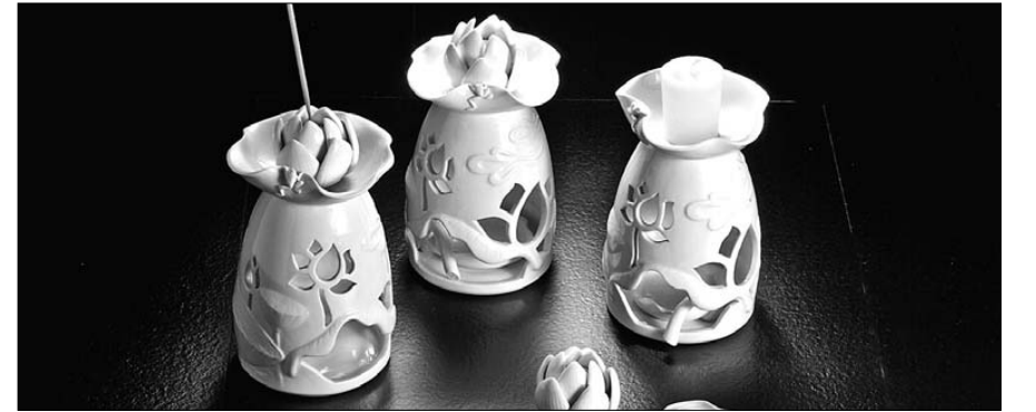
‘2013 디자인코리아’에 한국불교문화사업단이 출품한 불교문화상품 향로.