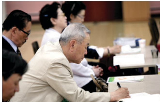
(사진왼쪽부터) 봉은연화대학에서 수업을 듣고 있는 어르신들. 연화대학 재학생과 졸업생들로 구성된 연화시니어봉사단 활동을 통해 어르신들도 지역사회를 위해 도움 받을 수 있다는 자부심을 심어준다. 대구 보성선원은 분기별로 지역 어르신을 위한 장수사진을 찍어 포교하고 있다.