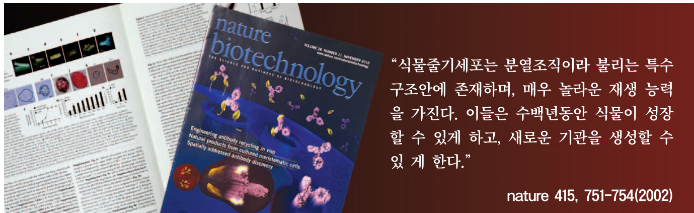
▲ 국내에서 개발한 식물줄기세포 분리, 배양기술은 2010년 11월 (네이처)지 표지논문으로 실렸습니다. 네이처지는 전 세계 최고의 생명공학 분야 학술지입니다.

심mani 생활을 오래한 사람들조차 산삼을 발견하면 '심봤다'라고 외칠 만큼 산삼은 발견하기 힘들다. 산세가 좋고 풍수가 뛰어난 심산유곡에서 일조량, 토양, 고도, 지형 등 모든 조건이 완벽하게 맞아야만 생명의 씨앗을 틔우는 고귀한 존재인 산삼은 이 세상에 존재하는 식물 중 가장 비싼 가격에 거래되는 식물이며 그 효과 또한 무궁무진하다. 허준의 동의보감이나 본초강목 등에 따르면 산삼은 원기를 북돋고 면역력을 높이며 심장, 폐, 간, 신장 등 오장육부의 기능을 향상시켜