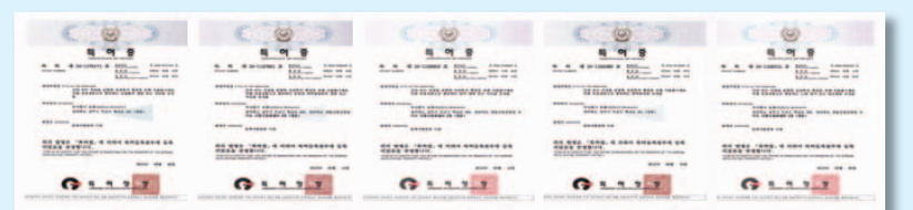
▲ 산삼배양세포의 유효성을 검증한 결과 항산화, 면역증강, 항노화, 간 보호 등의 유효 활성기능이 확인되었으며 특허로 등록되었다

산삼은 피로회복, 면역력증진, 정력 증진, 위·간 보호 등에 뛰어나며 세계대 바 있는 이 기술을 동양의 신비로 불리는 강원도산 50년근 산삼 사포닌이 인삼의 10배, 홍삼의 4-5배 이상 포함되어 있다. 과거부터 신비로 불리는 산삼 배양세포 '산삼 배양세포'에서 우리 몸을 회복시키는 획기적인 신기술 초로 시중에서도 찾아보기 매우 힘들 뿐더러 일반인이 접하기에는 더욱 어렵다. 최근 식물줄기세포를 세계 최초로 분리 배양한 특허기술이 국내 연구진에 의해 개발되었다. 세계적으로 권위있는 '네이처 바이오테크놀로지'의 표지 논문으로도 게재된 바 있는 이 기술을 동양의 신비로 불리는 강원도산 50년근 산삼 배양세포 '산삼 배양세포'에서 우리 몸을 회복시키는 획기적인 신기술 초로 시중에서도 찾아보기 매우 힘들 뿐더러 일반인이 접하기에는 더욱 어렵다. 최근 식물줄기세포를 세계 최초로 분리 배양한 특허기술이 국내 연구진에 의해 개발되었다. 세계적으로 권위있는 '네이처 바이오테크놀로지'의 표지 논문으로도