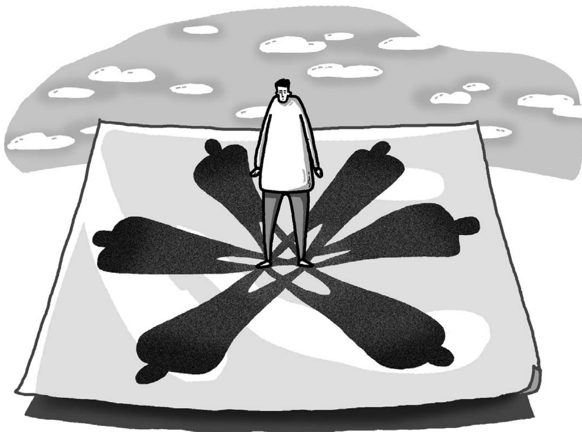
그림 · 최주현