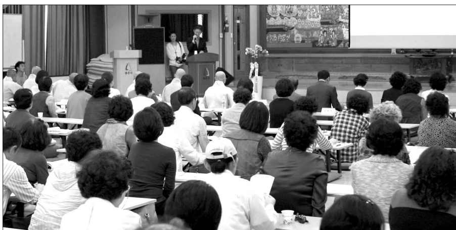
제1회 보우대사 학술세미나에는 신진학자들의 논문이 대거 입성했다.