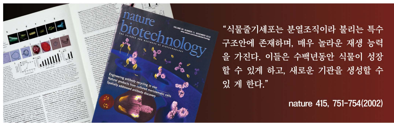
▲ 국내에서 개발한 식물줄기세포 분리, 배양기술은 2010년 11월 (네이처지) 표지논문으로 실렸습니다. 네이처지는 전 세계 최고의 권위의 생명공학 분야 학술지입니다.

허준의 동의보감이나 본초강목 등에 따르면 산삼은 원기를 북돋고 면역력을 높이며 심장, 폐, 간, 신장 등 오장육부의 기능을 향상시켜 준다고 한다. 그리고 항암작용, 노화예방, 정력증진, 동맥경화, 췌장기에도 뛰어난 효능이 있다고 한다. 진