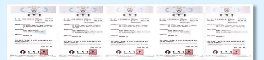
▲ 산삼배양세포의 유효성을 검증한 결과 항산화, 면역증강, 항노화, 간보호 등의 유효 활성기능이 확인되었으며 특허로 등록되었다

게제된 바 있는 이 기술을 동양의 신비로 불리는 강원도산 50년근 산삼에 접목한 것이다. 그결과 산삼의 줄기세포인 '산삼 배양세포'에서 우리 몸을 회복시키는 획기적인 신규물질이 다량 발견된 것이다. 국·내외 유수의 대학 및 연구기관들과 공동으로 이 산삼배양 세포의 유효성을 검증한 결과 항산화, 면역증강, 항노화, 간보호 등의 유효활성 기능이 확인되었으며 특허로 등록되었다.