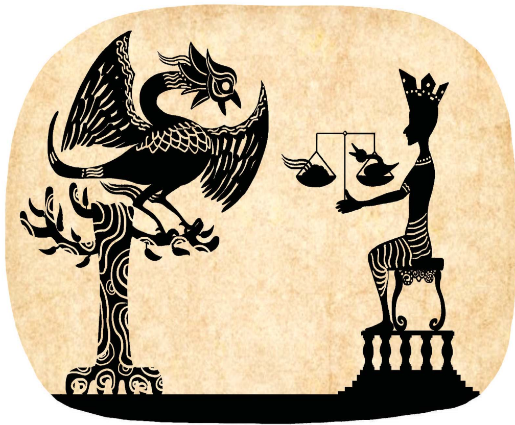
삽화 · 강병호

지혜가 없는 이는 말할 것이 없을 것이다.' 그리고 마음이 안정되자, 그때에 천지는 여섯 가지로 진동했고, 큰 바다에는 물결이 일었으며, 마른 나무에서는 꽃이 피었고, 하늘에서는 향의 비가 내리면서 좋은 꽃을 흠뿌렸으며, 천녀들은 노래고 찬탄했다. "반드시 부처님이 되실 것입니다." 제석은 왕에게 말했다. "당신은 살을 베어서 몹시 괴로울 터인데, 괴로워하거나 후회하지 않습니까?" 시비왕이 말했다.