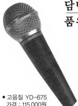
• 고품질 YD-675 가격 : 115,000원

「YD-675 高音質 다이내믹 마이크」의 답백하고, 맑고, 힘찬 소리는 스님의 품위를 한층 높여 드릴 것입니다.