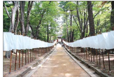
해인사 일주문 앞에 펼쳐진 해인아트프로젝트