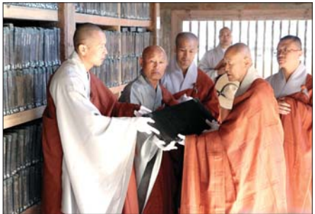
대장경 판전에서 대장경 경판을 이운하고 있다.