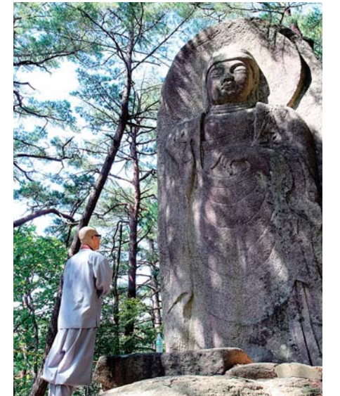
해인사 중봉에 위치한 마애불입상