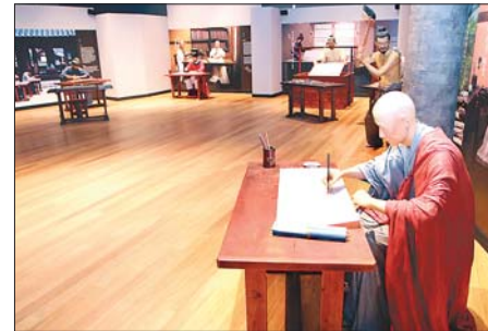
대장경천년관의 대장경 조성 과정 모형