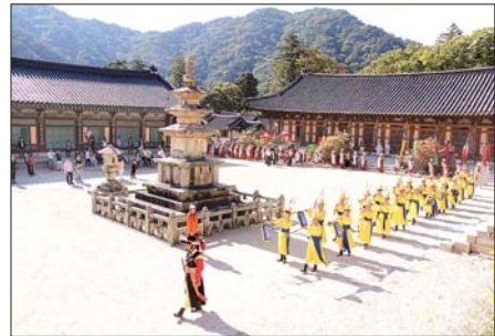
본 행사장 이운에 앞서 경내를 도는 이운행렬.