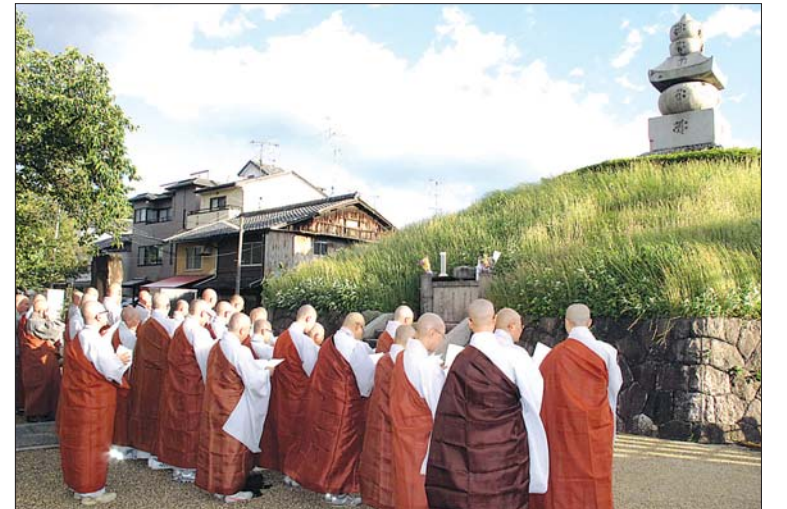
임진왜란과 정유재란 당시 희생당한 조선인 12만 6000명의 귀와 코가 묻혀있는 교토 남산사 인근의 이총(귀무덤)을 참배하는 순례단 스님들.

조계종 스님들이 임진왜란과 정유재란으로 희생된 선조들의 넋을 위로했다. 조계종 교육원(원장 현웅)은 9월 26일부터 30일까지 4박 5일동안 일본 관서지방 일대에서 ‘보광 스님과 함께 하는 일본 고찰 순례’를 진행했다. 이들 순례단은 첫 공식 행사로 교토 남산사 인근의 이총(임명 귀 무덤)을 찾아 두 번의 왜란으로 희생된 선조들의 넋을 기렸다. 이총은 400여년 전 발발한 왜란으로 희생된 조선인 12만 6000명