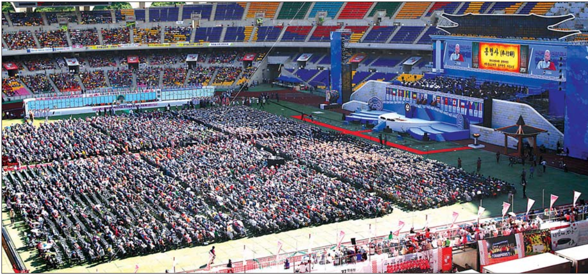
한국전쟁 정전 60주년을 맞아 한반도와 세계평화를 기원하는 한반도 평화대회가 9월 27일 부산 아시안드 주경기장에서 7만여 불자와 시민들이 동참한 가운데 열렸다.

“이제 우리는 지난날을 대오각성하고 ‘위도와 경의’, ‘화해와 상생’, ‘미래와 희망’이라는 인류번영의 꽃을 한반도와 동북아 그리고 세계에 만개시켜야 합니다. 공동번영을 위해 분쟁을 종식시키고 평화의 시대