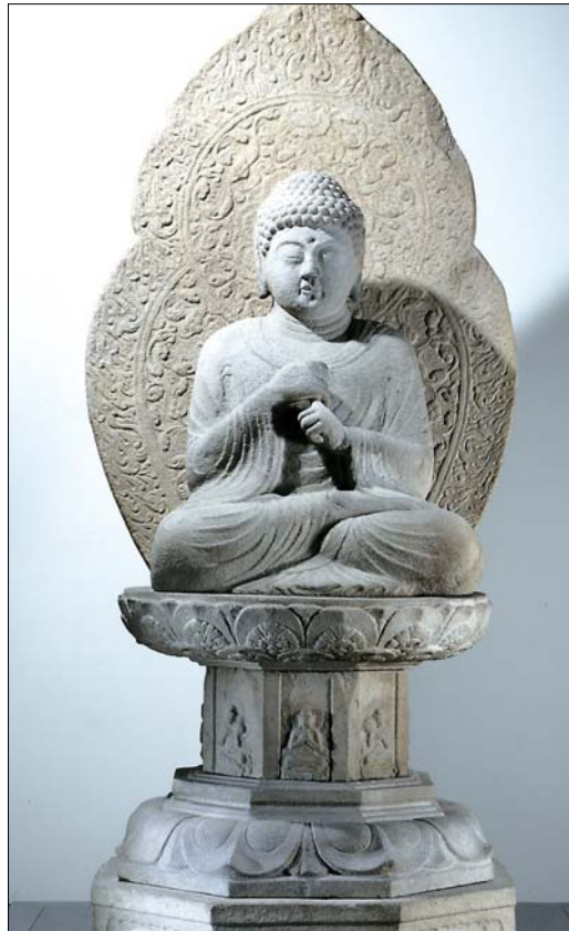
그림 ①. 영기좌에서 화생하는 비로자나불