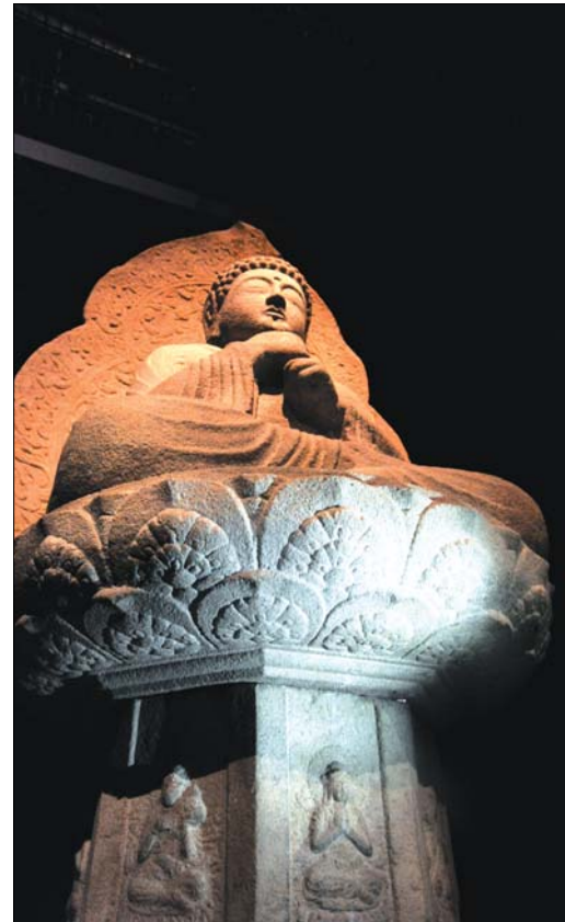
그림 ②. 영기좌를 밑에서 올려다 보고 사진 촬영한 것