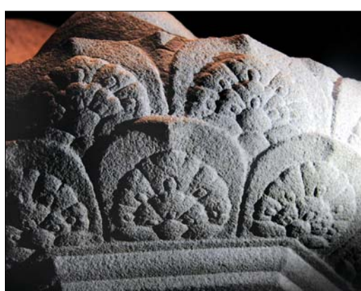
그림 ③. 상대 영기꽃잎의 조형