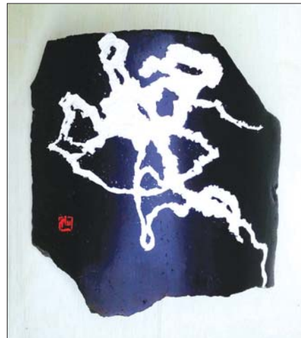
여공 스님의 '민달팽이 춤추다'

스님은 이번 전시를 준비하며 신기한 경험을 하기도 했다. 기와에 글귀를 새겨 놓았는데 글씨가 마음에 들지 않아 작업한 기와장 표면을 1~2밀리 정도 밀어 내고 그 위에 옷칠로 보강하고 찰흙죽으로 만든 접착제로 균열의 틈을 메우는 등 기초 작업상태로 만들어 놓았다.