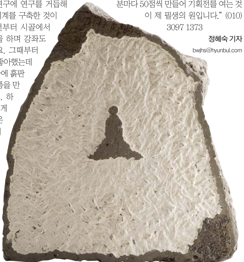
여공 스님의 '칼끝장엄'전이 10월 5일~13일 전등사 무설전 서운갤러리에서 열린다. 사진은 스님의 자화상을 표현한 '잘 되었다'