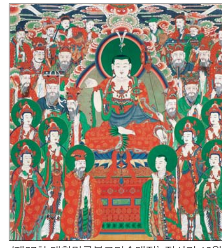
'제27회 대한민국불교미술대전' 전시가 10월 1일~17일 불교중앙박물관에서 열린다. 작품은 최우수상작인 일오 스님의 '석가모니후불탱'

최우수상작인 일오 스님의 '석가모니후불탱'은 보물 1612호로 지정된 법화사 대웅전불화를 그대로 재현했다. 전통적