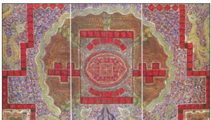
김영옥 작가의 만다라 개인전이 인사아트센터에서 10월 2일부터 열린다.