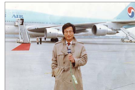
1989년 KBS 유럽 특파원 시절 국민 방문 보도 장면.