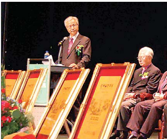
민해축전 1회 대회 때부터 사회를 맡아오고 있다.