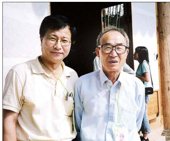
금강산 신계사에서 열린 세계시인대회에서 고은 시인과 함께.

그에게 시인은 삶의 이상향이었고 기자는 현실이었다. 오랜 시간 이 둘을 놓고 고민하기도 했지만 그의 결론은 결코 기사와 시가 다르지 않다는 것이다. “시는 언어의 압축이고 방송 기사 또한 일어난 사건을 압축하는 일이지요. 긍정적으로 생각하면 둘이 다르지 않