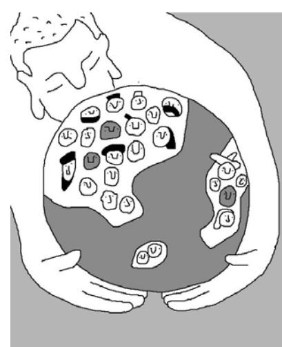
그림 · 박구원

부처님은 전쟁을 하지 말라고 했다. 그런데 우리가 소속한 국가들은 때로는 전쟁을 한다. 그것이 역사다. A국의 불자들은 A국을 위해서 전쟁에 참전하고, B국의 불자들은 B국을 위해서 전쟁에 참여한다. 국경이 있는 불교인/국민으로서서는 어쩔