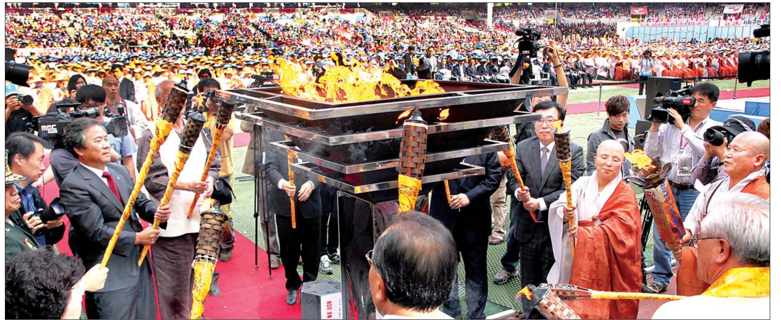
평화의 기운 한반도에 두루 퍼지길

9월 27일 부산아시아드주경기장에서 열린 한국전쟁 정전60주년 한반도평화대회에서 평화의 불이 사부대중의 염원 속에 안착되고 있다. 평화대회에서는 고불문과 평화선언과 함께 인순이, 이선희, 폴 포츠, 모스틀리 필하모닉 오케스트라 등 평화를 기원하는 다양한 공연이 펼쳐졌다. 이에 앞서 부산 UN기념공원에서 스님 1000여 명이 참석한 가운데 수룩제가 열려 한국전쟁 희생자의 넋을 기렸다.