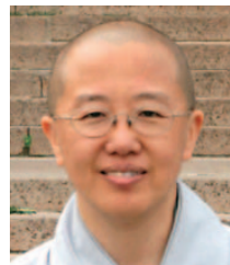
명법 스님 (조계종 교수사리)

'생각하는 사람'과 '반가사유상'은 서양 근대의 사유와 육체, 그리고 동양의 선정과 몸에 대한 전혀 다른 두 가지 태도를 반영하고 있다. 우리가 가 닿을 수 있는 사유의 깊이는 어디인지 되새겨볼 일이다.