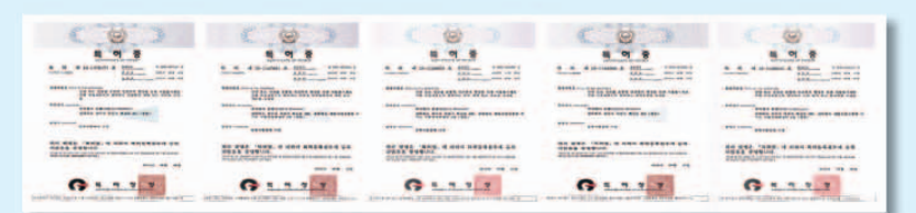
▲ 산삼배양세포의 유효성을 검증한 결과 항산화, 면역증강, 항노화, 간 보호 등의 유효 활성기능이 확인되었으며 특허로 등록되었다

산삼은 피로회복, 면역력증진, 정력 증진, 위·간 보호 등에 뛰어나며 세계된 바 있는 이 기술을 동양의 신비로 불리는 강원도산 50년근 산삼 사포닌이 인삼의 10배, 홍삼의 4-5배 이상 포함되어 있다. 과거부터 신비로운 '산삼 배양세포'에서 우리비의 명약으로 불리며 신성시된 약물을 회복시키는 획기적인 신규물질이다. 다량 발견된 것이다. 국내의 유수의 대학 및 연구기관들과 공동으로 이 산삼배양 세포의 유효성을 검증한 결과 항산화, 면역증강, 항노화, 간보호 등의 유효활성 기능이 확인되었으며 특허로 등록되었다.