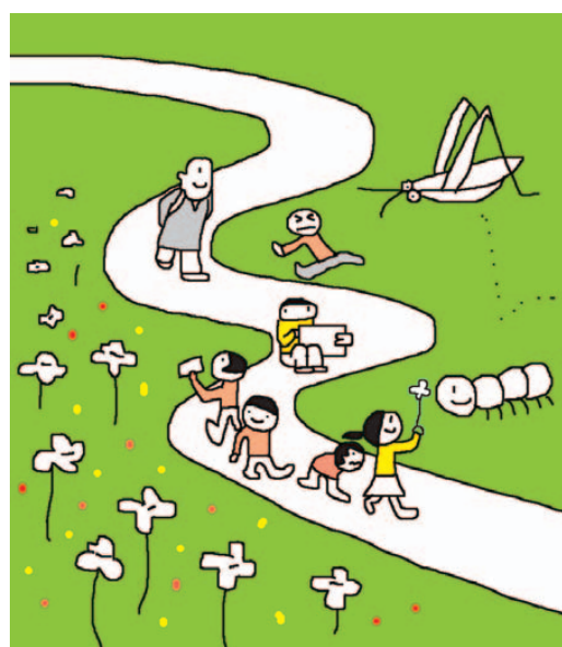
그림 · 박구원

오늘은 아침부터 백홍암 산행이 있는 날이다. 우리는 일찍 아침을 먹고 모여 얼굴에 재피임을 붙였다. 벌레를 아주 싫어하는 아이들을 위해서다. 숲속을 걸다가 날라리가 눈에 들어와서 고생을 했다는 아이들은 숲속을 걷는 것을 두려워한다. 요즘 아이들은 절에 오면 화장실 가는 것도 두려워한다. 그것은 다름 아닌 벌레 때문이다. 도시의 콘크리트 속에서 움직이는 곤충들을 거의 본적이 없는 아이들은 여지 한 마리만 방에 들어와도 난리가 난다. 재피임을 부치면 모에 날라리나 모기 같은 곤충들이 달려들지 않는다는 지혜를 한 봉사자가 귀뜸해줬다. 우리는 인디언처럼 얼굴에 재피임을 한껏 붙이고 출발을 하였다. 한창 더운 날씨지만 여름 숲은 그들이 많아서 인지 그리 덥