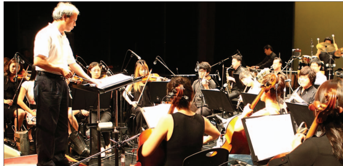
그는 2010년부터 뉴트리팜소스코스트라의 상임지휘와 음악감독을 맡고 있다.

이른 나이에 성공의 행복을 경험했던 그는 이른 나이에 어둠의 시간을 맞는다. 1990년대 초 3집 앨범을 끝으로 그의 이름은 대중들로부터 멀어진다. 또 다시 어두워진 시간. '인기'를 먹고, 밝은 조명 속에서 살았던 젊은 뮤지션이 견디어 내기엔 힘든 시간이었다. 그동안