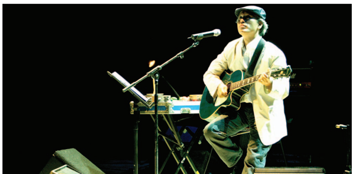
그는 2007년 두차례 개인콘서트를 여는 등 대중가수로서의 활동도 왕성하게 이어가고 있다.