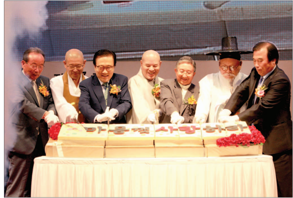
‘마음껏 사랑하세요’ 불교, 기독교, 천주교 등 7대 종교 지도자 모임인 (사)한국종교지도자협의회가 주최하는 제17회 대한민국종교문화축제가 9월 14일 서울 청계광장에서 열렸다. 이번 행사에서는 ‘마음껏 사랑하라’를 슬로건으로 ‘내려놓기’, ‘어울림’, ‘바라는 마음’, ‘나누리’ 네 가지 테마로 축제의 장을 펼쳤다. 사진은 총지협 공동대표 의장 자승 스님 등 7대 종교 지도자들이 공식행사 개막식에서 떡을 절단하는 장면.