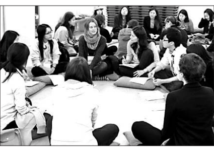
대불청은 지난 4월 '연동회 서포터즈'로 활동할 내·외국인 자원봉사를 모집해 자원봉사교육을 실시했다.

이와 함께 템플스테이 프로그램인 서포터즈 프로젝트는 내·외국인 청소년 각 30명을 모집해 진행된다. 프로젝트 참가자