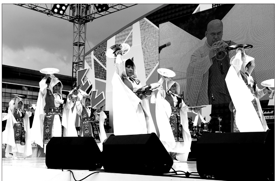
동대부여고는 서울특별시교육청이 9월 6~8일 개최한 '2013 서울평생학습축제' 개막식 공연무대에 오르기도 했다.

이외 우 교법사는 "학교평생교육은 학교의 다양한 시설과 공간을 활용해 차별화된