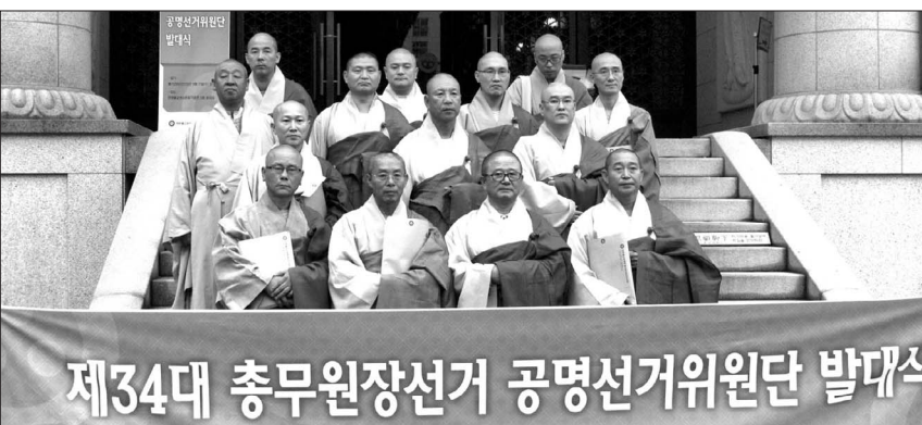
조계종 중앙선거관리위원회는 9월 11일 공명선거위원회 발족식을 개최했다. 공명선거위원회는 부정선거 감시 등 청정한 선거를 위한 활동을 진행한다.

오는 10월 10일 열리는 조계종 제34대 총무원장 선거를 공명 정당한 선거로 이끌기 위한 조직이 공식 발족했다.