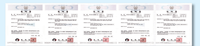
▲ 산삼배양세포의 유효성을 검증한 결과 항산화, 면역증강, 항노화, 간보호 등의 유효 활성기능이 확인되었으며 특허로 등록되었다

그 결과 산삼의 줄기세포인 '산삼 배양세포'에서 우리 몸을 회복시키는 획기적인 신규물질이 다량 발견된 것이다. 국내의 유수의 대학 및 연구기관들과 공동으로 이 산삼배양 세포의 유효성을 검증한 결과 항산화, 면역증강, 항노화, 간보호 등의 유효활성 성분이 확인되었으며 특허로 등록되었다.