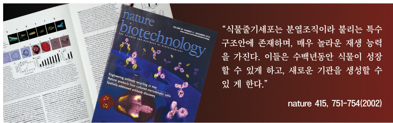
▲ 국내에서 개발한 식물줄기세포 분리, 배양기술은 2010년 11월 (네이처지) 표지논문으로 실렸습니다. 네이처지는 전 세계 최고의 권위의 생명공학 분야 학술지입니다.

허준의 동의보감이나 본초강목 등에 따르면 산삼은 원기를 북돋고 면역력을 높이며 심장, 폐, 간, 신장 등 오장육부의 기능을 향상시켜 준다고 한다. 그리고 항암작용, 노화예방, 정력증진, 동맥경화, 췌장기에도 뛰어난 효능이 있다고 한다. 진