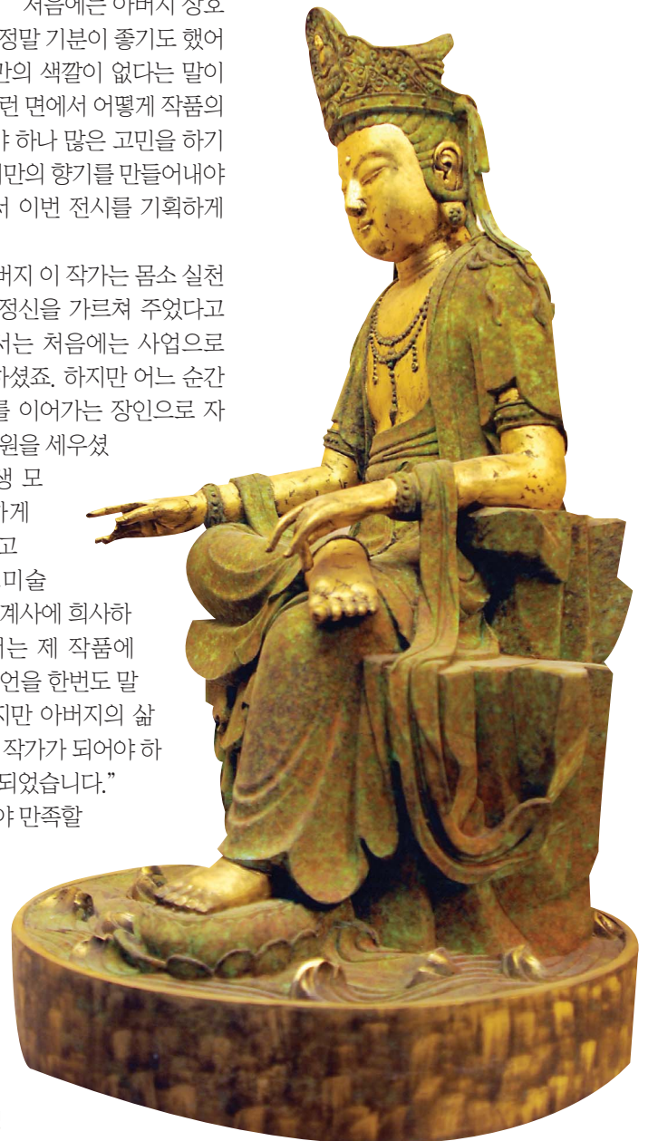
수월관음. 청동에 채색