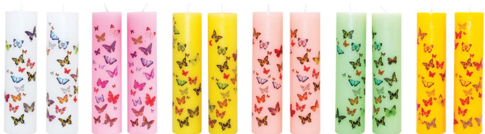
나비양초 - 화이트 / 핑크 / 옐로우 / 살구 / 그린 / 개나리 (7.4f×29cm)