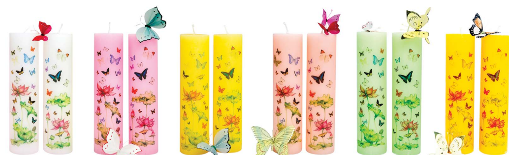
연꽃나비양초 - 화이트 / 핑크 / 옐로우 / 살구 / 그린 / 개나리 (7.4f×29cm)