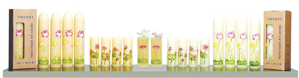
수공예예술양초 - 밀납 / 약삭아광연봉연꽃양초 / 약삭1호예술연꽃양초 / 아광 연꽃초