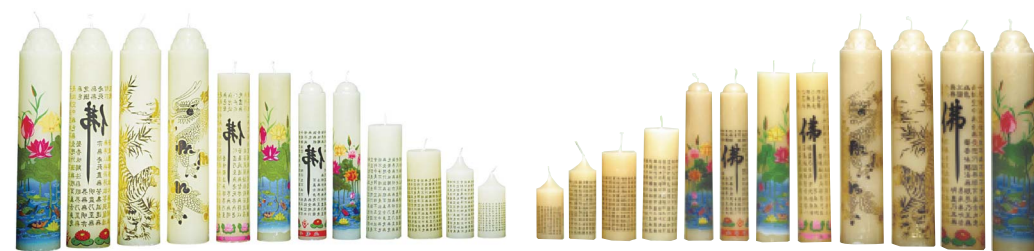
한봉밀납양초 - 4호 / 3호 / 2호 / 1호 / 밀대전사자 / 돈타래전사자 / 원기동전사자