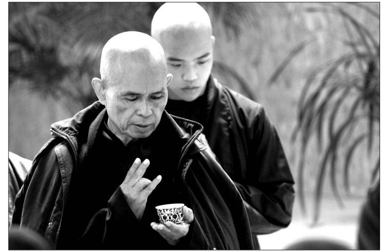
틱낫한 스님이 3개월간 미국과 캐나다 등을 방문한다. 스님의 통찰력과 지혜를 배우고자 구글 등 IT기업이 스님을 초청했다. 틱낫한 스님은 첨단기기와 현대인들의 삶의 조화에 대해 강의할 예정이다.

구글이 틱낫한 스님에게 가르침을 청했다. 스님은 9월 말 미국 캘리포니아에 위치한 구글 본사를 방문, 강연을 할 예정이다. 스님은 알아차림을 통해 얻을 수 있다고 얘기해 온 혁신과 통찰 등에 관한 이야기를 전할 계획이다.