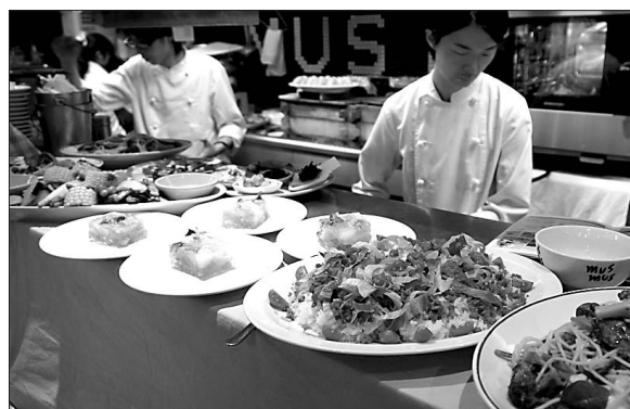
도쿄 변화기에 불교 카페가 생겼다. 고급 레스토랑이 즐비한 최고급 쇼핑몰에 자리한 코야산 카페에서는 채식 음식을 맛볼 수도 있고(좌) 스님들의 염불을 들을 수도 있다.(우)

와 가까워진다는 데 의의가 있죠. 삶을 온전히 사는 법을 일러주는 데 불교가 도움을 줄 수 있었으면 합니다"고 말했다.