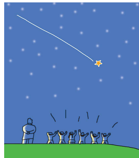
그림 · 박귀원