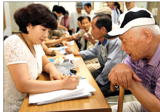
입구 접수대에서 간호봉사자들이 어르신 상태를 점검하고 있다.