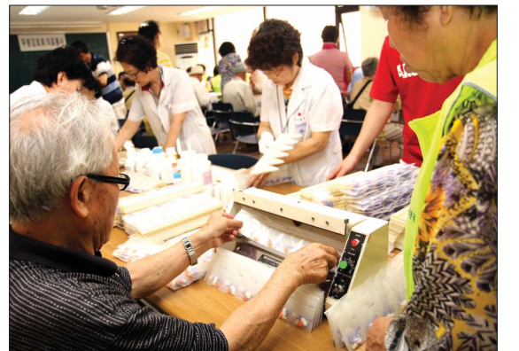
나이가 많은 노약사분도 노력 봉사로 동참하고 있다.