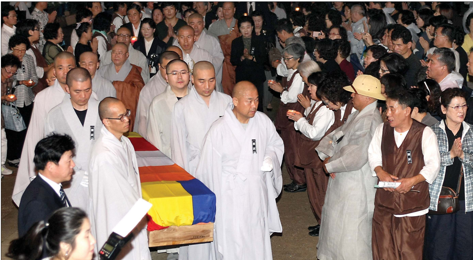
40년 주석처 조계사와 작별 조계종 원로의원 혜명당 무진장 대종사의 원적을 추모하는 대속야제가 9월 12일 조계사 대웅전에서 열렸다. 비가 오는 곳은 날씨에도 불구하고 사부대중 1천여명이 참가해 스님의 원적을 애도했다. 스님의 법구는 법사로 주석했던 동국대를 거쳐 영결식장이 마련된 범어사로 운구됐다.