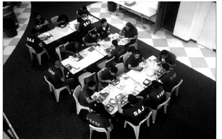
미국 코네티컷에 있는 교도소에서 수감생활을 하는 한 불자 수감자가 채식 권리를 주장하고 나서 관심을 모으고 있다.

미국의 한 불자 재소자가 교도소 내 '채식의 권리'를 주장하고, 동물보호단체가 이를 옹호하고 나서 세간의 화제가 되고 있다.