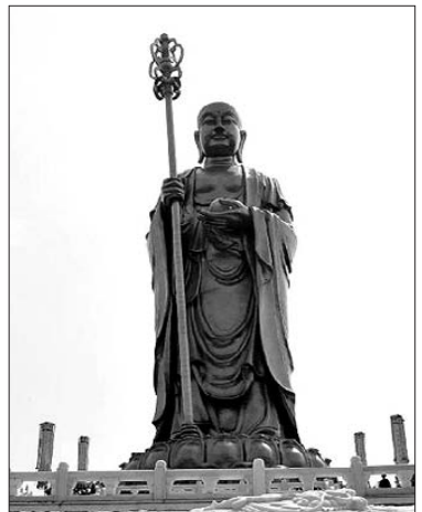
중국 지장보살 성지로 꼽히는 구화산에 조성된 지장보살상. 99미터라는 세계 최고 높이를 자랑한다.