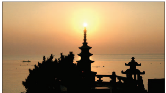
해동용궁사 사리탑 일출모습