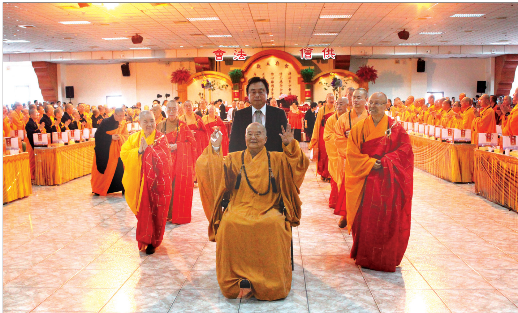
대만 불광산사는 8월 28일 운제루에서 공승법회를 봉행했다. 사진은 법회가 끝난뒤 휠체어를 탄 성운대사가 사부대중을 향해 손을 흔드는 모습.