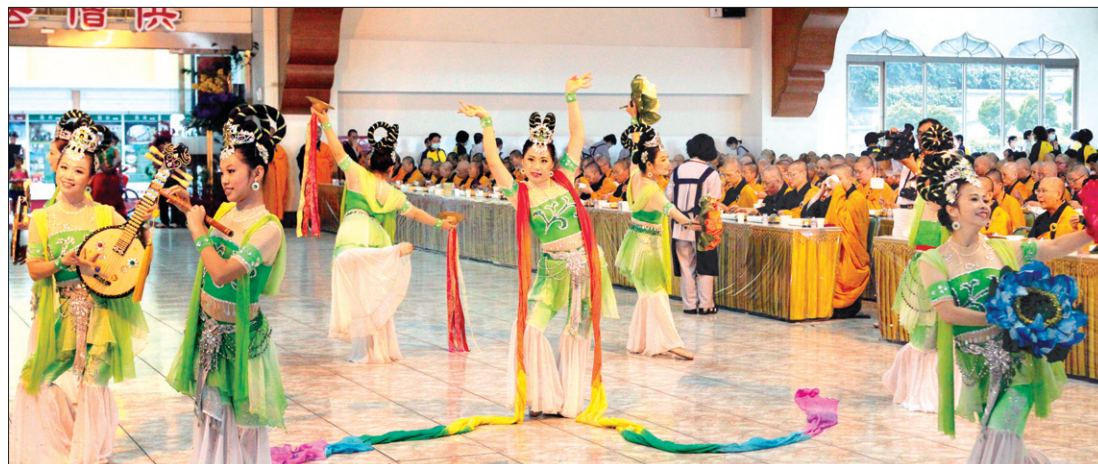
화려하면서도 품위가 있고 단조로운 듯하면서도 세련미가 묻어나는 보살무 축하공연.