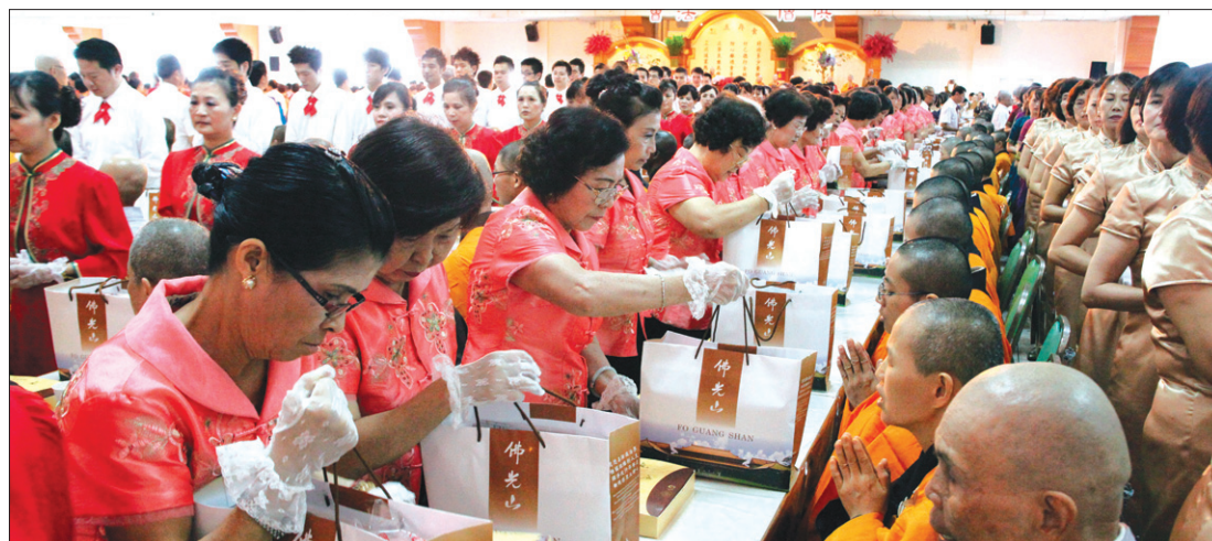
공승법회에 참가한 스님들에게 공양 선물을 올리는 장면. 이 자리에는 26개국에서 참가한 사부대중 7천 명이 참여했다.