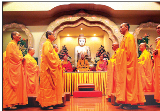
공승법회에 앞서 열린 임제종 49대 법맥 전수식(사진 오른쪽)과 수계식 장면(사진 왼쪽).