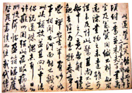
추사의 편지가 있는 <나가묵언첩>

이러한 사실은 추사의 편지에 종종 언급되었는데, 특히 <완당전집> <여초의> 27신과 <나가묵언첩>, <영해태운첩>에 수록된 이 편지는 스승 곁에서 그림 수업에 열중했던 정황은 상세한데 그 내