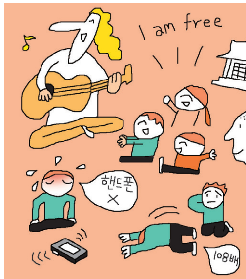
그림 · 박구원

은 교환학생이다. 연등축제에서 외국인 서포터즈로 활약하면서 사찰생활에 호감을 갖게 되어 지원했다고 한다.