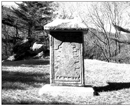
평창 월정사 적멸보궁의 사리탑비