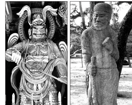
경주 불국사 사천왕 중 동방지국천왕(좌)과 경주 원성왕릉 무인상(우)