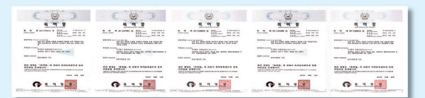
▲ 산삼배양세포의 유효성을 검증한 결과 항산화, 면역증강, 항노화, 간보호 등의 유효 활성기능이 확인되었으며 특허로 등록되었다

게재된 바 있는 이 기술을 동양의 신비로 불리는 강원도산 50년근 산삼에 접목한 것이다. 그결과 산삼의 줄기세포인 '산삼 배양세포'에서 우리 몸을 회복시키는 획기적인 신규물질이 다량 발견된 것이다. 국·내외 유수의 대학 및 연구기관들과 공동으로 이 산삼배양 세포의 유효성을 검증한 결과 항산화, 면역증강, 항노화, 간보호 등의 유효활성기능이 확인되었으며 특허로 등록되었다.