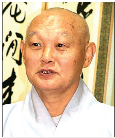
원행스님 자광사 주지, 삼화사 주지, 구룡사 주지 등 임원 현재 월정사 부주지

지학승 주교도 월정사 방산굴로 스님을 자주 찾아 와서 스님과 시국에 대한 말씀을 나누었어요. 그럴 때에 저는 차상을 올려다 드리고 나왔기에, 두 분의 대화 내용을 알 수는 없었지요. 하여간에 두 분은 시국과 나라를 고민하시면서 많은 소통을 하신 것으로 알고 있어요. 그리고 원주와 연고가 있는 최규하 대통령도 스님과 만나신 적이 있습니다. 최규하 대통령이 원주 봉산동 출신입니다. 그래서 저와도 많은 인연이 있습니다. 국무총리 시절에는 구룡사 불사를 후원해 주시고 그랬지요. 부인인 흥기여사도 불자이고요. 하여간에 12·12가 터지고 나서 최규하씨가 대통령권한대행이라는 자리에 오르지 않았습니까? 바로 그 자리에 오르던 그날 저녁에 제가 월정사에 있었는데 최규하 대통령이 극비리에 오셨어요. 탄허 스님을 만나시려고요. 저는 차대접만 해드리고, 방을 나와서 두 분이 하신 대화는 전연 알 수가 없지요. 두 분은 고뇌에 찬 표정이었습니다. 최규하 대통령은 수심이 많은 얼굴이었어요. 하여간에 분위기가 그랬어요. 그렇게 대화를 하신 후에 다음날 새벽 두 시쯤 가신 것으로 기억하고 있습니다.