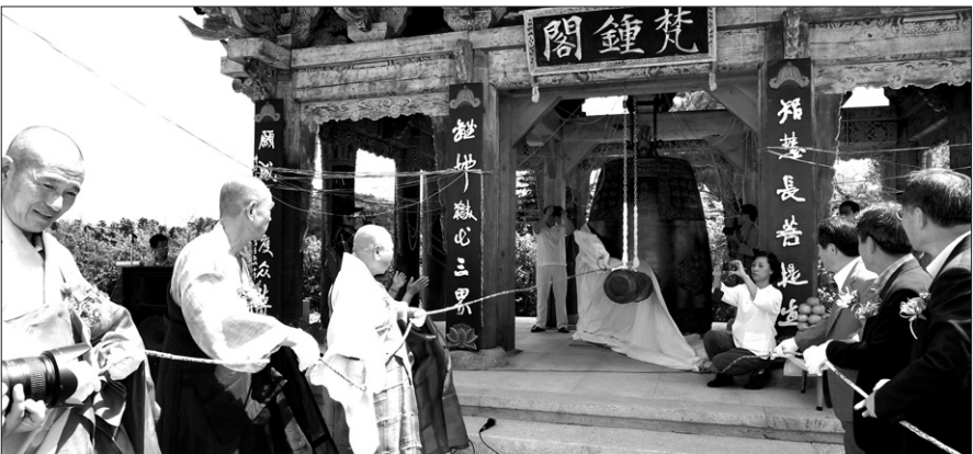
회향사 스님들이 보광사 범종각 막사를 축하하는 제막을 하고 있다.

회향사 문도의 발상지인 담양 보광사(주지 신원)가 8월 13일 사찰 중창을 마무리하는 범종각·범종불사 회향 법회를 봉행했다.