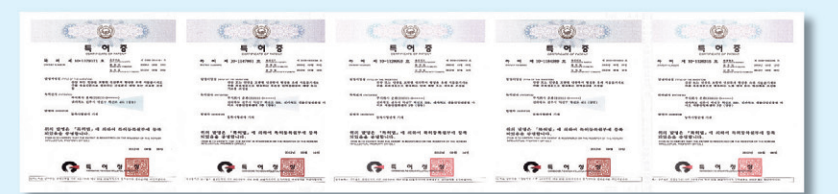
▲ 산삼배양세포의 유효성을 검증한 결과 항산화, 면역증강, 항노화, 간보호 등의 유효 활성기능이 확인되었으며 특허로 등록되었다

국·내외 유수의 대학 및 연구기관들과 공동으로 이 산삼배양 세포의 유효성을 검증한 결과 항산화, 면역증강, 항노화, 간보호 등의 유효활성 기능이 확인되었으며 특허로 등록되었다.