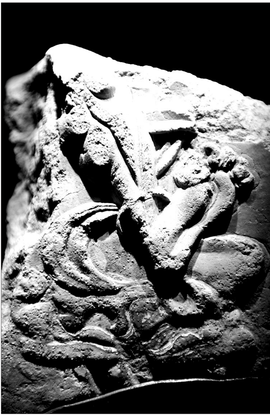
양지가 머물던 석장사에서 출토된 문양토우