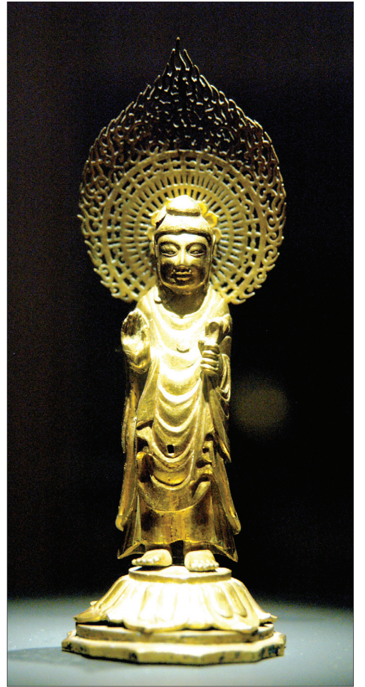
경주 황복사 석탑에서 발견한 '금제 여래입상'

그대로 받아들여 수미좌나 수미단이란 용어를 많이 쓴다. 이 용어는 일본 식민지시대에 들어온 말이다. 즉 수미산 정상에는 도리천이 있으며 제석천이 머물고 있는 것이지 여래가 머물러 있지 않았을뿐더러 그 정상에 앉아 있는 것도 아니다. 수미산은 불교 이전부터 있던 인도 본래의 우주관의 산물인데 그 산의 모든 것을 그대로 불교의 모든 것으로 설명하려니 그 오류가 산처럼 쌓여가는 것이다. 문자언어로 쓰여진 모든 이야기에는 오류들이 엄청나게 많다. 지금까지의 길은 반야의 길이 아니라 파멸에 이르는 길이다. 여래가 앉거나 서있는 자리를 대좌라고 부르는 것은 여래를 바라보고 사람이라 부르는 것과 같다. 여래가 앉아 계시는 자리는 대좌나 수미좌나 수미단이 아니라, 여래가 영기화생(靈氣化生)하는 극적인 광경을 보여주는 큰 가르침을 우리에게 보여주는 것이다. 그 자리를 잘못 부르고 있거나 기록이 있어도 의미가 없으므로 결국 대부분의 용어가 쓸모없는 것이 되고 말기에 필자가 속고 끝에 만들어 낼 수밖에 없다. 지금까지 수많은 용어들을 올바르게 잡아가는 보편적 방법론은 바로 영기화생론(靈氣化生論)이다. 그 이론이 정립되지 수많은 용어들의 오류가 수면 위로 또 올랐기 때문에 이 이론으로 풀어야 할 수밖에 없다. 고대문헌이라고 무조건 믿어서는 안 된다. 모든 기록은 조형미술이 만들어진 다음, 훨씬 후대에 잘못 기록된 것이 많다. 여기 경주 황복사 석탑에서 발견한 금제 여래입상이 있다. 692년 이전에 제작한 삼국시대 양식을 보여주는 불상으로 높이는 14센티에 지나지 않으나 우리나라 불상 가운데 가장 아름다운 조각품 가운데 하나다. 자, 이 여래상은 단지 대좌에서 계시는 모습이 아니다. 그렇다고 연화대좌위에 서 계시는 것도 아니다. 수미좌나 수미단에서 계시는 것은 더욱더 아니다. 그러면 도대체 이 여래는 우리에게 어떤 광경을 보여주고 있는 것일까.