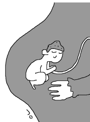
그림 · 박구원

우리는 여래장의 존재이다. 어머니의 태 속에 들어가서 빛을 발하고 있는 존재가, 지금 이 세계에 한 돌이 아니지 않은가. 그렇다. 수도 없이 많다. 우리 모든 존재들이 다 그렇게 빛을 발하고 있는 발광체(發光體)로서 여래장이다.