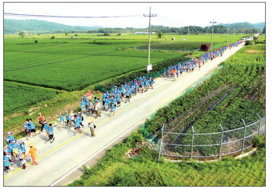
철원 DMZ지대를 행군하는 모습