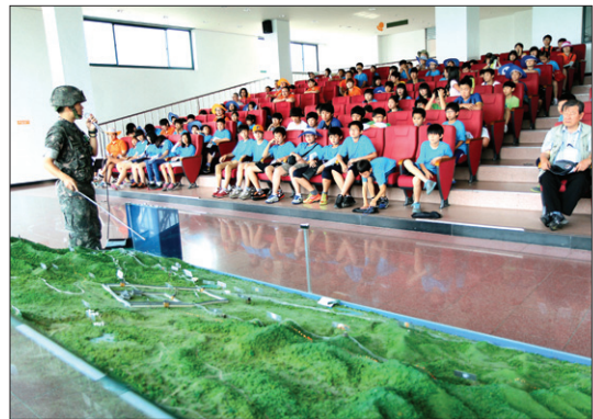
27일 평화전망대에서의 정훈교육 모습