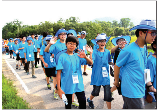
파란 한반도티를 맞춰입은 순례단