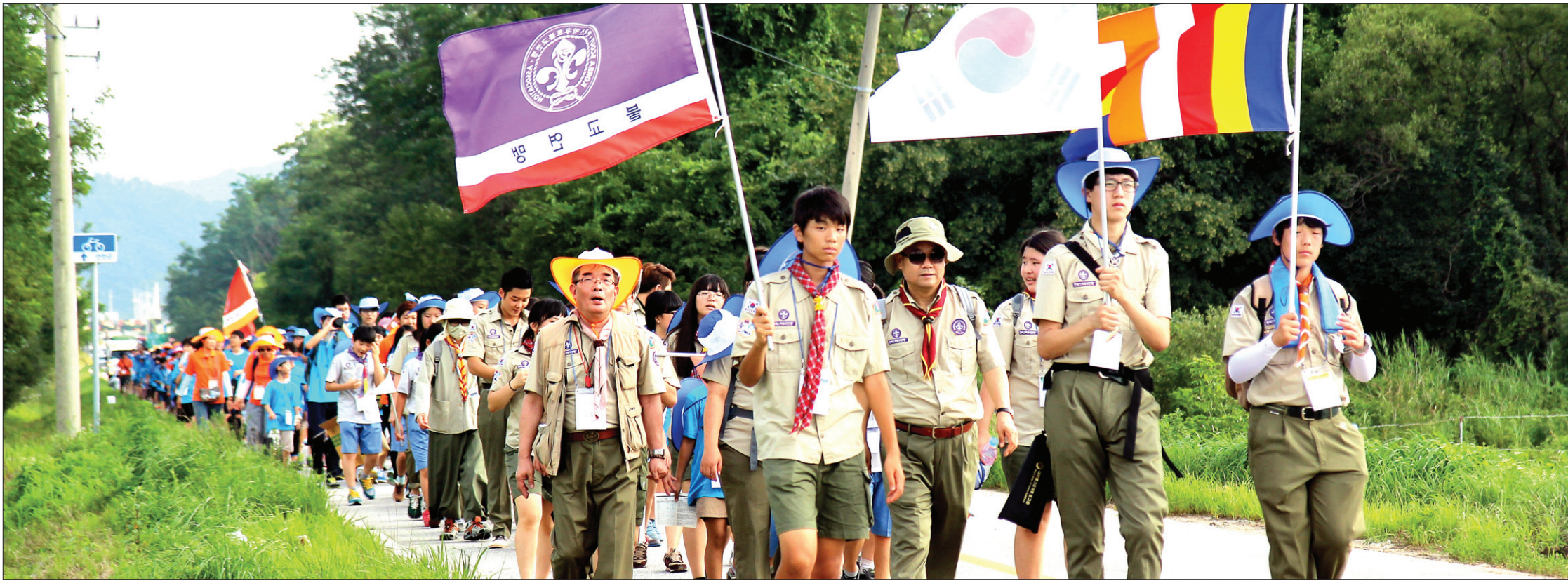
DMZ평화순례단은 7월 26일 철원 노동당사를 출발한 뒤 통제소를 거쳐 민간인통제선 내에서 평화통일을 발원하며 순례했다. 무더운 날씨 속에서도 순례단 학생들은 활기찬 모습으로 행사에 임했다.