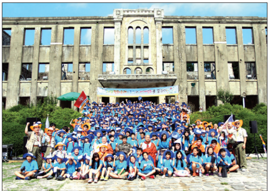
26일 철원 노동당사에서 진행된 입제식

정전 60주년인 27일에는 아침예불을 통해 정전일을 기념했다. 이와 함께 평화전망대와 제2땅굴 탐방이 진행됐다. 불자 청소년들의 교육이 진행되는 동안 어린 아이들답게 다양한 질문을 쏟아져 나왔다. “정전 직전까지 서로를 향해 총탄을 날리던 이 지역은 수십만명의 선열이 희생을 통해 지켜낸 곳입니다. 당시 치열한 전투가 전개된 백마고지, 피의 능선 등이 바로 저 곳입니다. 특히 북한과 가장 가까운 곳이기도 합니다. 제2 땅굴이 있는 곳에서 북한 지역은 불과 1km 밖에 떨어져 있지 않습니다.” “그럼 지금 저희들도 북한에서 보고 있는 건가요?” “왜 북한이 판 땅굴이 더 많지는 않아요?” “전망대 앞쪽에도 모두 그럼 지뢰밭일건가요?” 처음보는 북한의 모습에 순례단 학생들은 호기심을 감추지 못했다. 정훈교육 이후 순례단 학생들은 생안경을 통해 북한 초소 등을 관찰하고 전망대 교육관에서 안보교육 등을 이어갔다. “평화 통일, 우리가 이끈다. 평화 통일, 우리가 이끈다.” 순례단은 매 행사마다 구호로 ‘평화 통일’을 외치며 마음을 하나로 모았다. 이 땅에 충성이 맺은 그 날 이후 60년, 청소년들의 가슴에 평화의 영글고 있었다. 철원=노덕현 기자 noduc@hyunbul.com