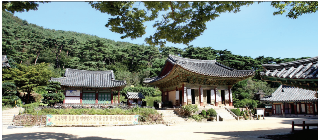
현존 한국 사찰 중 가장 오래된 역사를 가진 전등사

된 것이 서기 372년이므로 지금은 그 소재를 알 수 없는 성문사, 이불란사(375년 창건)에 이어 전등사는 한국 불교 전래 초기에 세워진 이래, 현존하는 최고(最古)의 도량이다. 당시 아도 화상은 강화도를 거쳐 신라 땅에 불교를 전한 것으로 알려지고 있다. 아도 화상이 강화도에 머물고 있을 때 지금의 전등사 자리에 절을 지었으니 그때의 이름은 '진종사(眞宗寺)'였다. 그 후 고려 제27, 28, 30대의 충숙왕(忠肅王)·충혜왕(忠惠王)·충정왕(忠定王) 때에 수축하였고, 1625년(인조 3)과 1906년에도 중수하였으며, 또 일제강점기에도 두 차례 중수하여 오늘에 이른다. 전등사라는 이름은 충렬왕(忠烈王:재위 1274~1308)의 비 정화궁주(貞和宮主)가 이 절에 옥등(玉燈)을 시주한 데서 비롯되었다. 이때 정화궁주는 승려 인기(印奇)에게 <대장경>을 인간(印刊), 이 절에 봉안하도록 했다. 이 절에는 보물 제178호인 전등사 대웅전(大雄殿), 보물 제179호인 전등사 약사전(藥師殿), 보물 제393호인 전등사 범종(梵鐘)이 있다. 또 대웅전에는 1544년(중종 39) 정수사(淨水寺)에서 개판(改版)한 <묘법연화경(妙法蓮華經)>의 목판 104장이 보관되어 있다.