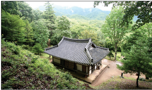
'무소유'의 법정 스님이 머물렀던 불일암

불일암에 들어서면 작은 텃밭이 보이고, 돌계단 위로 법당이 산을 짚고 있다. 법정 스님이 생전에 손수 심었던 후박나무 한 그루가 법당 앞에 서있는데, 법정 스님은 다비 후 그 나무 곁으로 돌아갔다. 그리고 법당 모서리에는 스님이 쓰시던 의자가 놓여 있다. 작지만 큰 암자다.