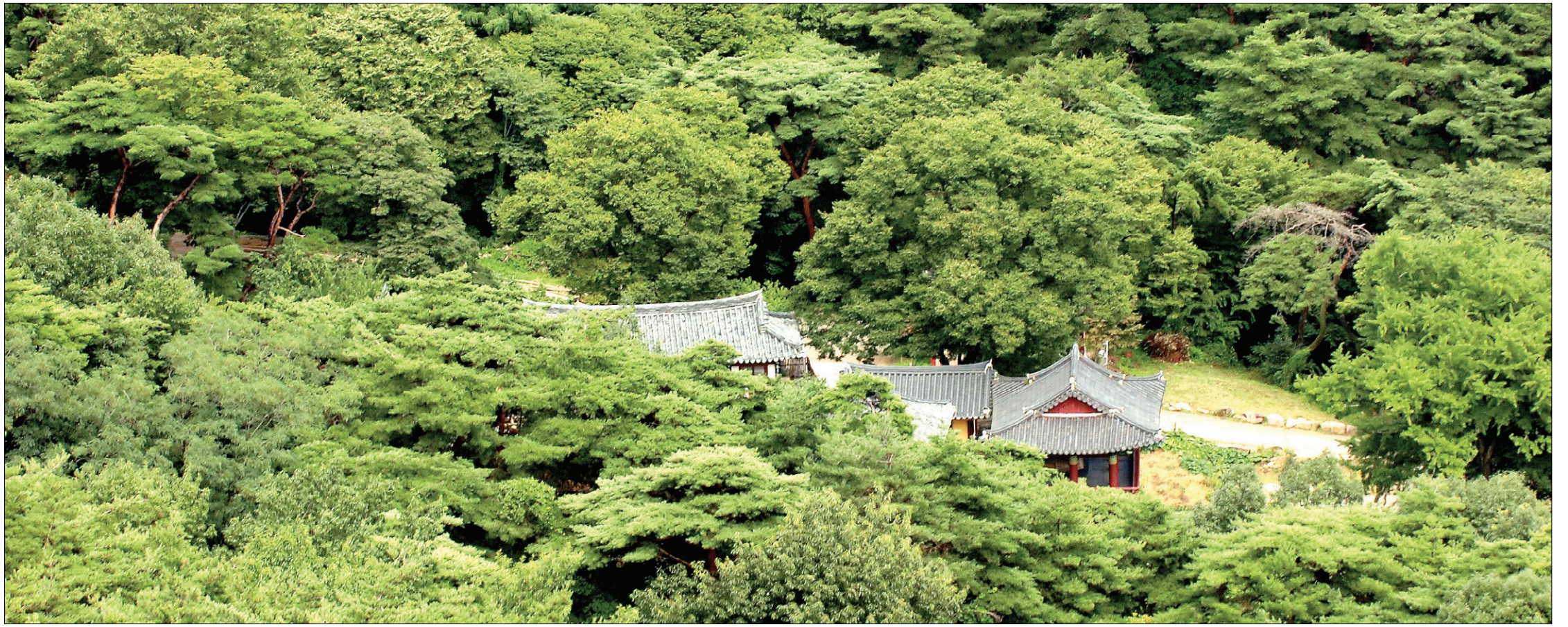
반야용선을 기다리는 용선대에서 바라본 관룡사 전경