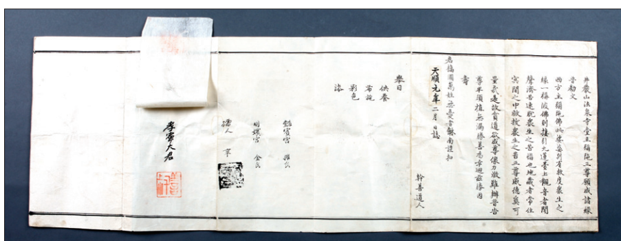
흑석사 목조아미타여래좌상 불복장 유물 중 하나인 '아미타삼존불조성보존문'

대구박물관은 "목조아미타여래좌상은 1458년에 정암산 법천사에서 태종의 후궁인 의빈 권씨와 명빈 김씨를 비롯해 태종의 아들인 효령대군, 세종의 부마인 연창위 안맹담 등 왕실의 후원으로 조성된 것으로 전한다"고 설명한다.