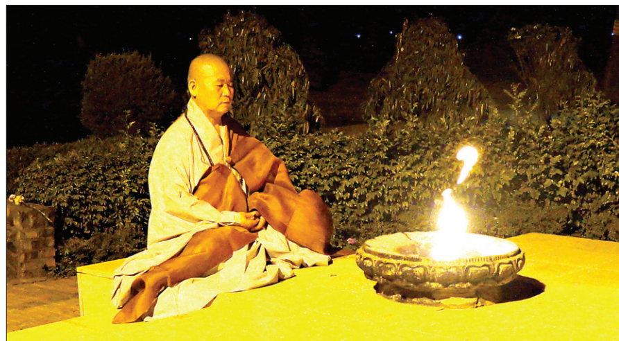
108산사 순례단의 평화의 불 이온 과정을 담은 KBS1 특집 다큐 '룸비니에서 DMZ까지, 평화의 불을 밝히다'가 7월 28일 방송됐다.