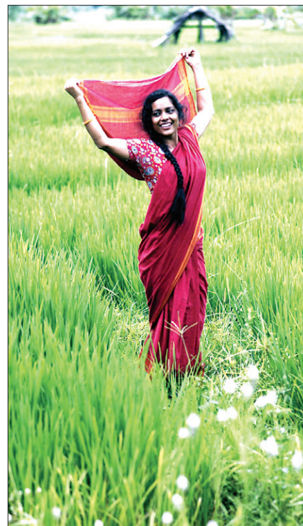
인도춤을 소재로 한 '바라, 축복(Vara, a Blessing)'의 한 장면.

스님의 영화는 굳이 불교적 메시지를 강조하지는 않는다. 스님에게 있어 영화는 좋은 도구라고 말한다. "불교 수행자는 과학자하고 비슷합니다. 과학자가 과학하고