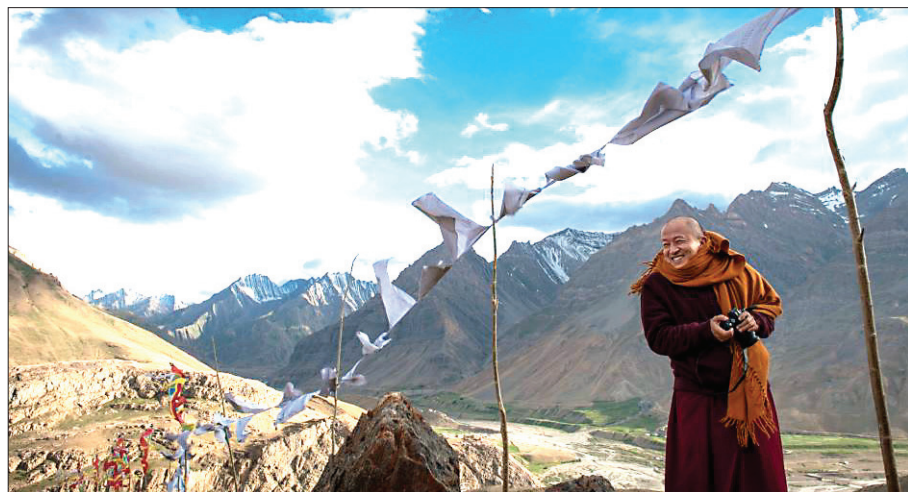
세계적인 영화감독이자 티베트의 존경받는 불교 지도자 중 한 명인 종사르 켄체 린포체가 8월 2일~4일 한국을 방문한다.

"인도 전통 춤을 무척 좋아해서 영화로 만들고 싶었습니다. 그동안 저한테 익숙한 소재로 영화를 만들었다면 이번 영화는 매우 도전적인 소재였어요. 새로운 경험이 되었습니다. 인도 사원을 배경으로 신분이