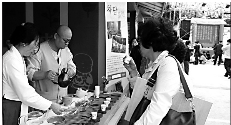
승시는 '무소유'의 승가 전통을 되살리고 고대 사원경제의 축으로 자리한 승단의 전통 정터를 재현하는 자리다.

남 연구원은 “중국불교는 성장과정에서 제왕과 귀족의 경제적 지지를 많이 받았는데 북방의 경우 고승들이 적극적으로 정치에 참여하여 많은 노동력을 확보해 사원의 경제적 토대를 만든 반면, 남방의 경우는 다수의 토지를 확보해 사원의 경제적 토대