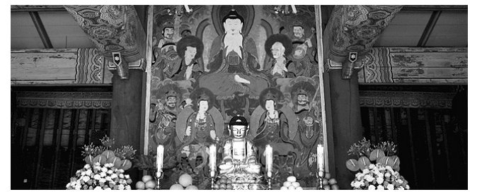
7월 6일 점안식을 가진 봉은사 판전 비로자나불 후불탱화

봉은사(주지 진화)는 7월 6일 판전 비로자나불 후불탱화 점안식을 봉행했다.