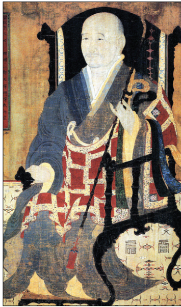
서산대사 진영 · 작자미상, 18세기

우리나라 옛 그림에서 가장 큰 부분을 차지하는 것이 산수화지만, 그림이 처음 나타나 발달하기 시작한 것은 인물화였고, 당시는 인물화를 더 중요하게 여겼다. 그림 기법에서도 먼저 발달한 인물화는 역사에서 배울 수 있는 교훈을 내용으로 하므로 보는 이에게 윤리를 중시하는 삶의 가치를 가르쳐 주었기 때문이다. 삼국시대에 높은 수준으로 발달했고, 고려와 조선을 거치면서 화풍과 내용이 변하면서 초상화를 비롯한 다양한 인물화가 꾸준히 그려