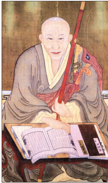
화담대사 진영 · 작자미상 19세기