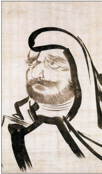
김명국 작 달마도 17세기

졌다. 생활과 사상, 문화 등 시대의 관심사가 표현된 인물화는 역사의 기록이자 자화상이다. 책에서는 우리나라에서 발달한 여러 가지 인물화를 초상화, 고사인물화, 도석인물화로 나누어 대표적인 작품들을 살펴본다. 그림에 담긴 이야기와 이를 아름답게 표현한 화가들이 뛰어난 솜씨를 통해 삶과 혼을 오롯이 느낄 수 있다.