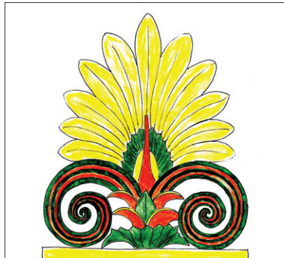
그림 ③ 채색분석, 노란 색으로 칠한 것이 영기문이며 잎이 아니다