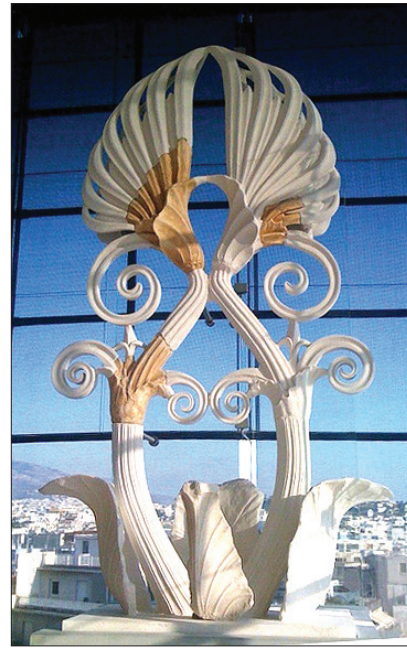
그림 ⑥-1 파르테논 신전의 아크로테리온, 기원 전 438년경, 대리석, 높이 4미터