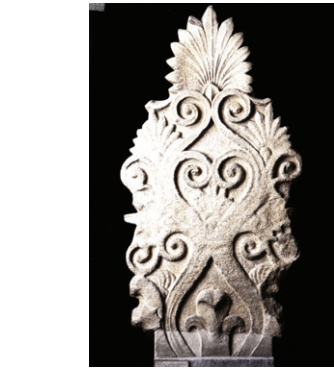
그림 ①-1 수니온의 포세이돈 신전, 동쪽 페디먼트의 중앙 아크로테리온, 기원 전 440년경. 영어 설명, tendrils(덩굴), acanthus leaves(아칸서스 잎) and anthemion(anthemion의 복수, 인동당초) 등으로 구성됨. 그러나 갖가지 제3영기씩 넝쿨모양 영기문으로 구성되어 있다고 설명

그리스 신전에서 발산하는 강력한 영기를 밝히게 된 것은, 내가 한국의 공포와 지붕 위의 갖가지 용과 보주의 상징을 풀었기 때문이었다.