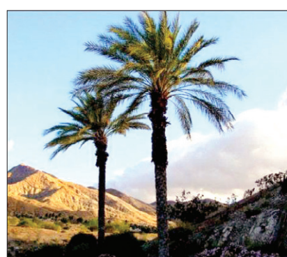
그림 ② 종려나무