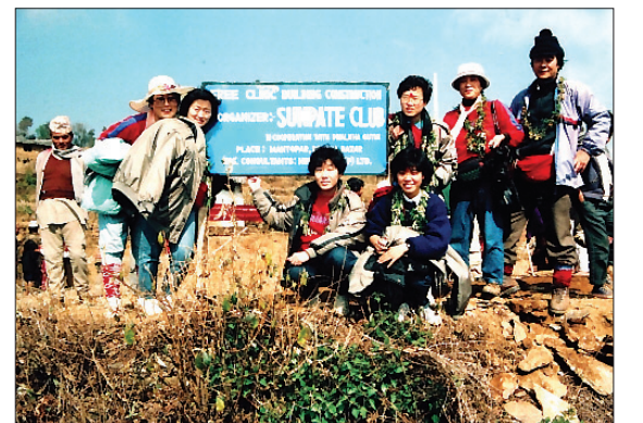
1969년 제1회 네팔의료봉사 때의 모습