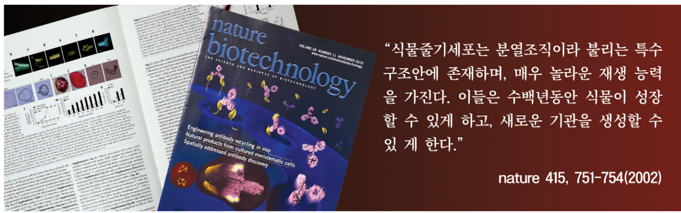
▲ 국내에서 개발한 식물줄기세포 분리, 배양기술은 2010년 11월 (네이처지) 표지논문으로 실렸습니다. 네이처지는 전 세계 최고의 권위의 생명공학 분야 학술지입니다.

◆ 전설 속의 명약 '산삼' 세상에서 가장 좋은 약초가 뭐냐고 묻는다면 누구나 첫손에 꼽는 것이 있다. 바로 산삼이다. 산삼이 좋다는 것은 누구나 아는 사실이지만 실제로 보거나 먹어본 사람은 극히 드물다. 꿈속에 산삼령이 나타나 산삼이 있는 위치를 알려주었다는 이야기나 죽은 줄 알았던 어머니가 산삼을 먹고 살아났다는 이야기가 있을 정도로 산삼은 전설속에 존재하는 약초인양 멀게만 느껴져 왔다. 동양의학 최고의 신약(神藥)으로 칭송받는 산삼은 몸을 보하고 부족한 것을 채워주며 막힌 곳을 열어 줄 뿐 아니라 정신을 맑게 하고 모든 고통을 이겨내게 만들어 준다고 전해진다. 하지만 우리는 시중에서 산삼을 찾아보기 힘들뿐더러 수십년 묵은 산삼을 찾았다 하면 뉴스에 나올 정도로 놀라운 일이다. 산삼은 그야말로 존재는 하지만 볼 수 없는 전설 속의 명약인 셈이다.