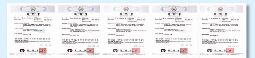
▲ 산삼배양세포의 유효성을 검증한 결과 항산화, 면역증강, 항노화, 간보호 등의 유효 활성기능이 확인되었으며 특허로 등록되었다

산삼은 피로회복, 면역력증진, 정력 증진, 위·간 보호 등에 뛰어나며 세계 각지에 퍼져 있는 이 기술을 동양의 신비로 불리는 강원도산 50년근 산삼 사포닌이 인삼의 10배, 홍삼의 4-5배 이상 포함되어 있다. 과거부터 신비의 명약으로 불리며 신성시된 약초로 시중에서도 찾아보기 매우 힘들 뿐더러 일반인이 접하기에는 더욱 어렵다. 최근 식물줄기세포를 세계 최초로 분리 배양한 특허기술이 국내 연구진에 의해 개발되었다. 세계적으로 로권위있는 '네이처바이오테크놀로지'의 표지 논문으로도 게재된 바 있는 이 기술을 동양의 신비로 불리는 강원도산 50년근 산삼에 접목한 것이다. 그결과 산삼의 줄기세포인 '산삼 배양세포' 에서 우리 몸을 회복시키는 획기적인 신구물질이 다량 발견된 것이다. 국내·외 유수의 대학 및 연구기관들과 공동으로 이 산삼배양 세포의 유효성을 검증한 결과 항산화, 면역증강, 항노화, 간보호 등의 유효활성기능이 확인되었으며 특허로 등록되었다.