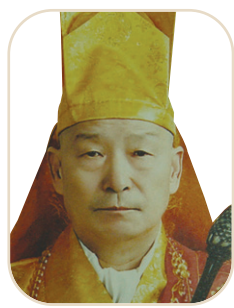
종정 명진 석법운 대종사

새로운 불교, 혁신적인 종지종풍으로 이어가기 위하여 석가세존으로부터 법맥을 이어온 저희 종단은 구태불교를 개혁하고, 시대가 요구하는 올바른 불교의 모습을 정립해 나갈 것입니다. 한국불교 중흥과 불교세계를 염원하는 사단법인 대한불교응공조계종은 본 종단과 함께하실 제방의 청정승려의 많은 동참을 바랍니다.